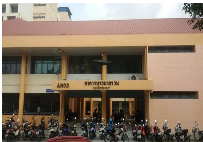
ภาพอาคารบรรณายรวม คณะศิลปศาสตร์