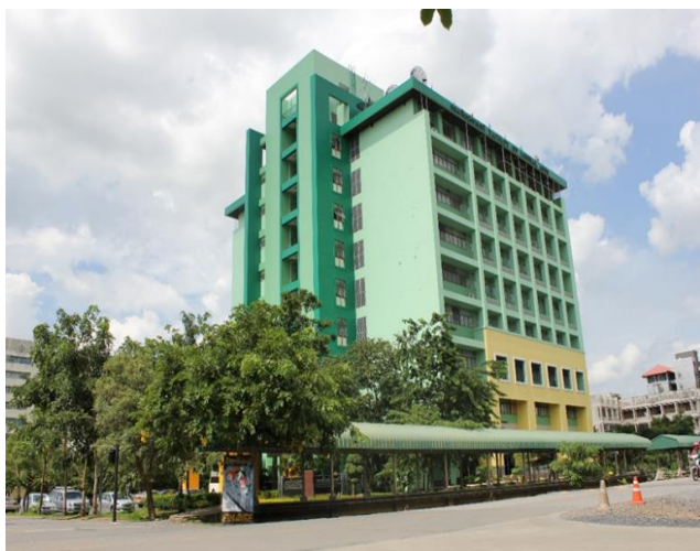
ภาพ อาคารเรียนและปฏิบัติการ 9 ชั้น